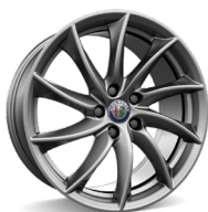
Veloce 8,0 x 18

(1) Sis. Run flat renkaat 19" kevytmetallivanteiden yhteydessä 3CX