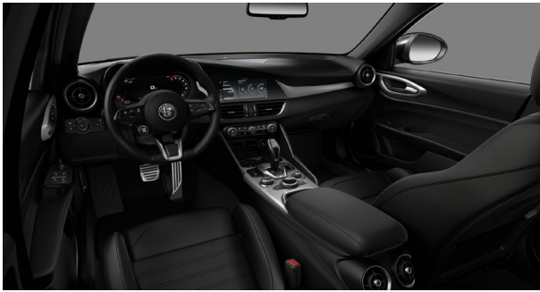
473 | Istuimien nahkaverhoilu