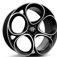
Speciale Etu 8,0 x 19 / taka 9,0 x 19