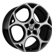
Veloce 8,0 x 19