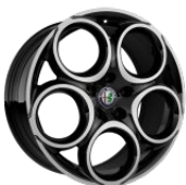
Classico 7,5 x 18