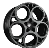
Prototipo 8,0 x 20